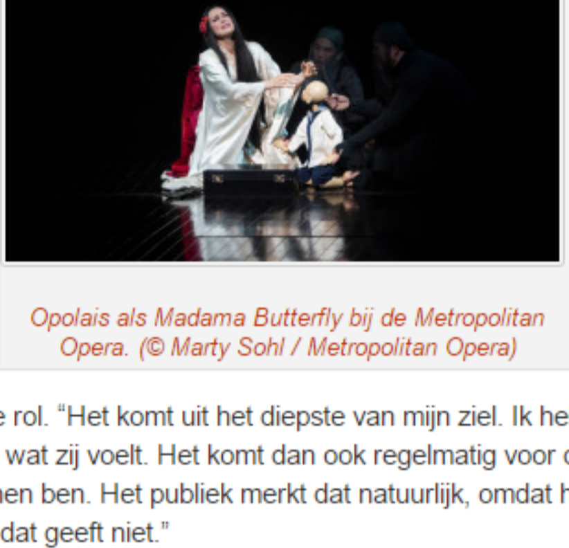
Opolais als Madama Butterfly bij de Metropolitan Opera.