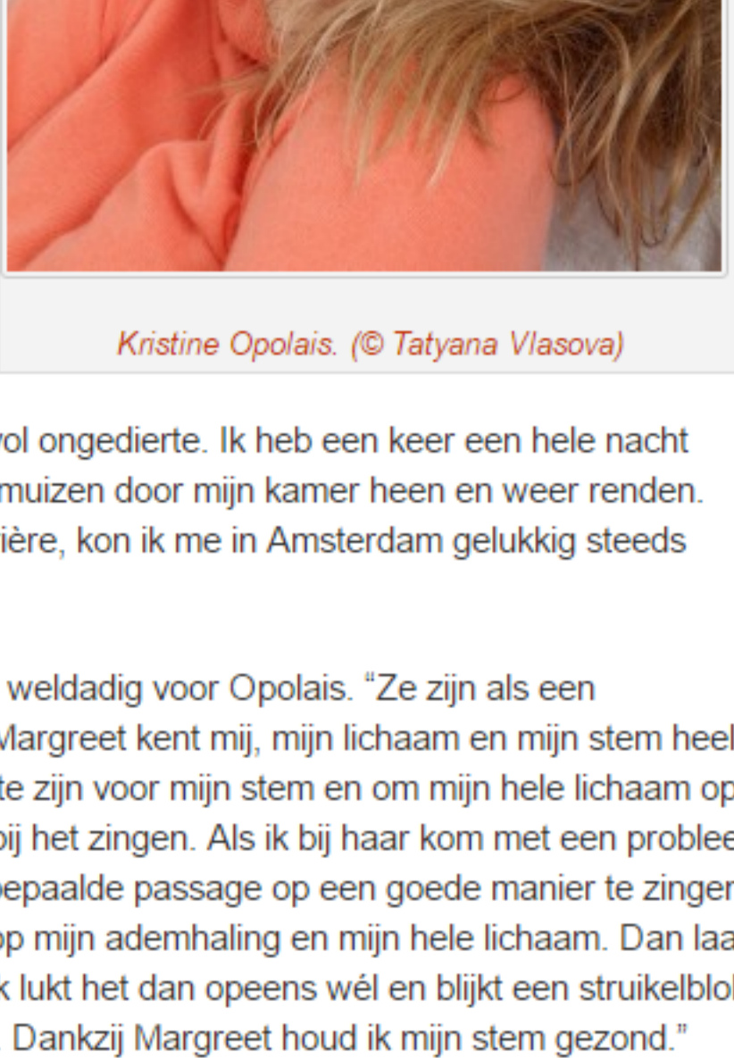
Kristine Opolais.