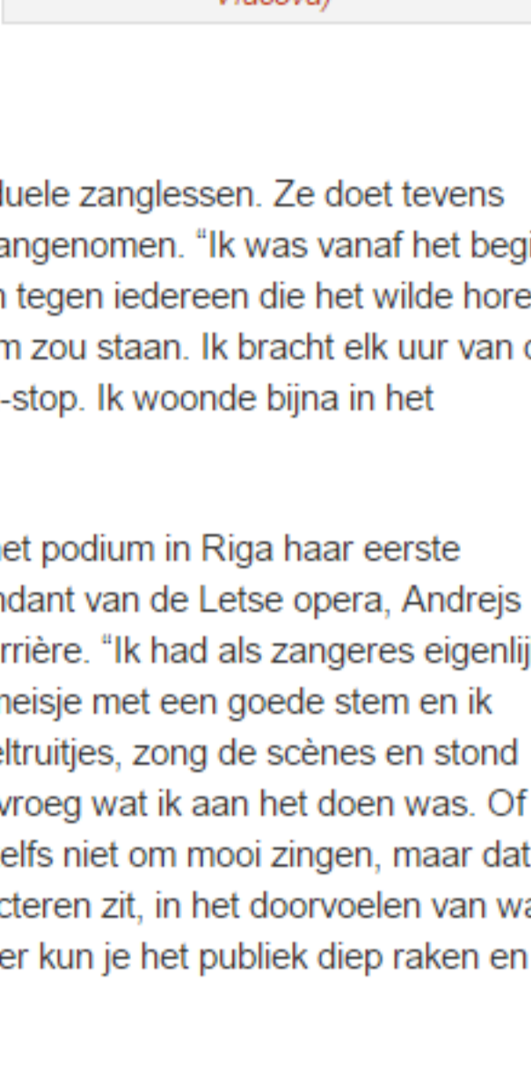
Kristine Opolais: “Ik zie zo veel jonge zangeressen die er beeldschoon uitzien en die een prachtige stem hebben, maar die toch niet écht weten te acteren.”