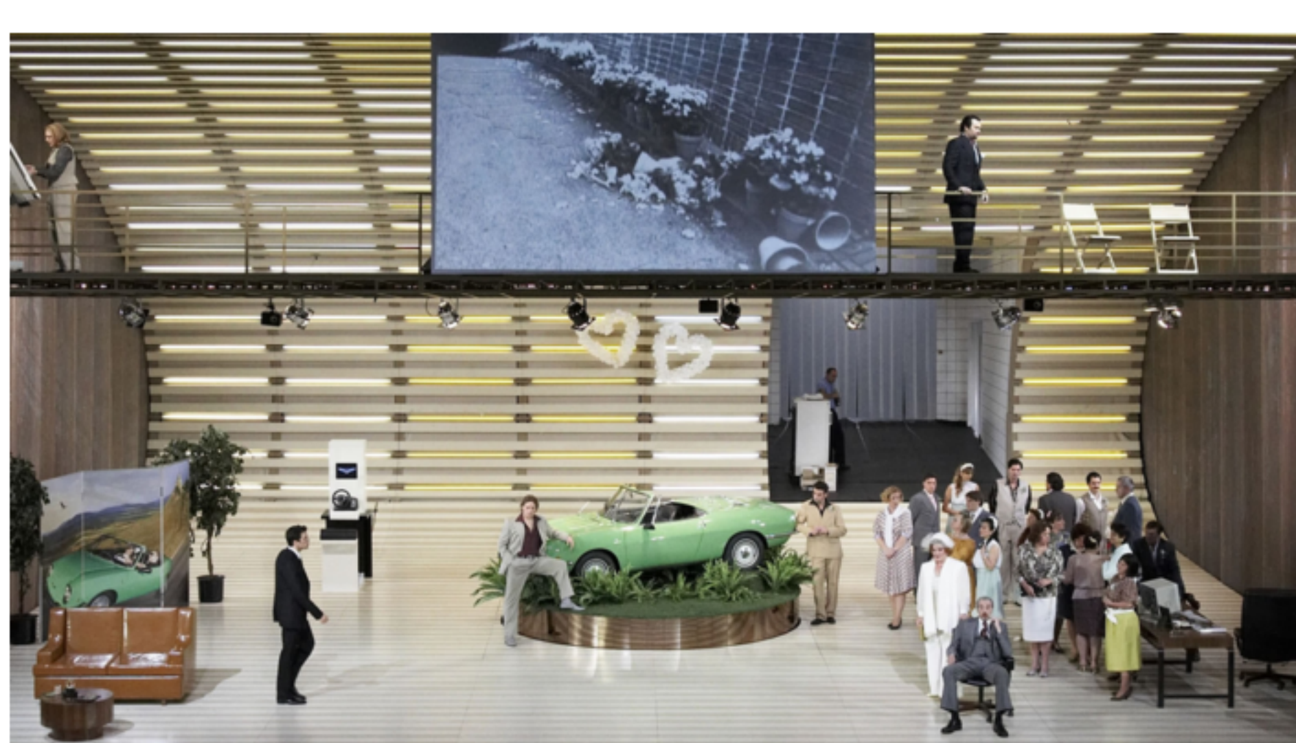
De Nationale Opera: Le Nozze di Figaro van W.A. Mozart (2010)

De kracht van muziek wordt mooi expliciet gemaakt in een bekende scène in de film The Shawshank Redemption (1994). Eén van de hoofdpersonen laat als daad van rebellie het 'canzonetta sull' aria' uit Le Nozze di Figaro , een opera van Mozart, over het hele terrein van een bedrukkende gevangenis klinken. Alle gevangenen staken hun bezigheden en richtten hun blik naar boven, zichtbaar vervuld van een gevoel van innerlijke vrijheid dat niet kan worden aangetast door de gevangensmuren. De muziek raakt niet alleen een snaar bij de gevangenen, maar wordt tegelijkertijd óók ingezet om het acteerwerk kracht bij te zetten en de emotionele impact van de scène bij de kijker te vergroten.