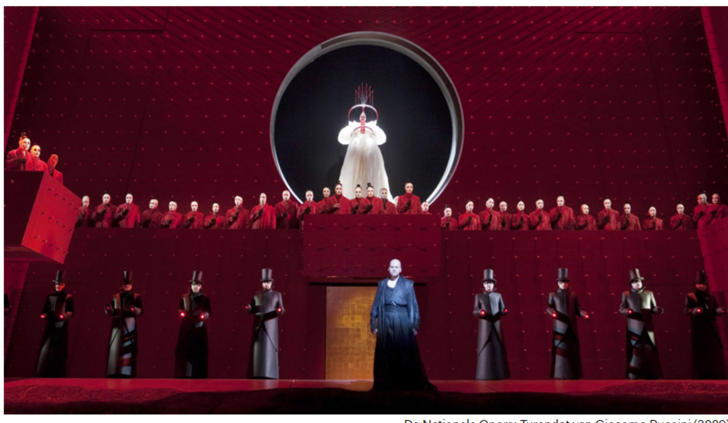
De Nationale Opera: Turandot van Giacomo Puccini (2009)